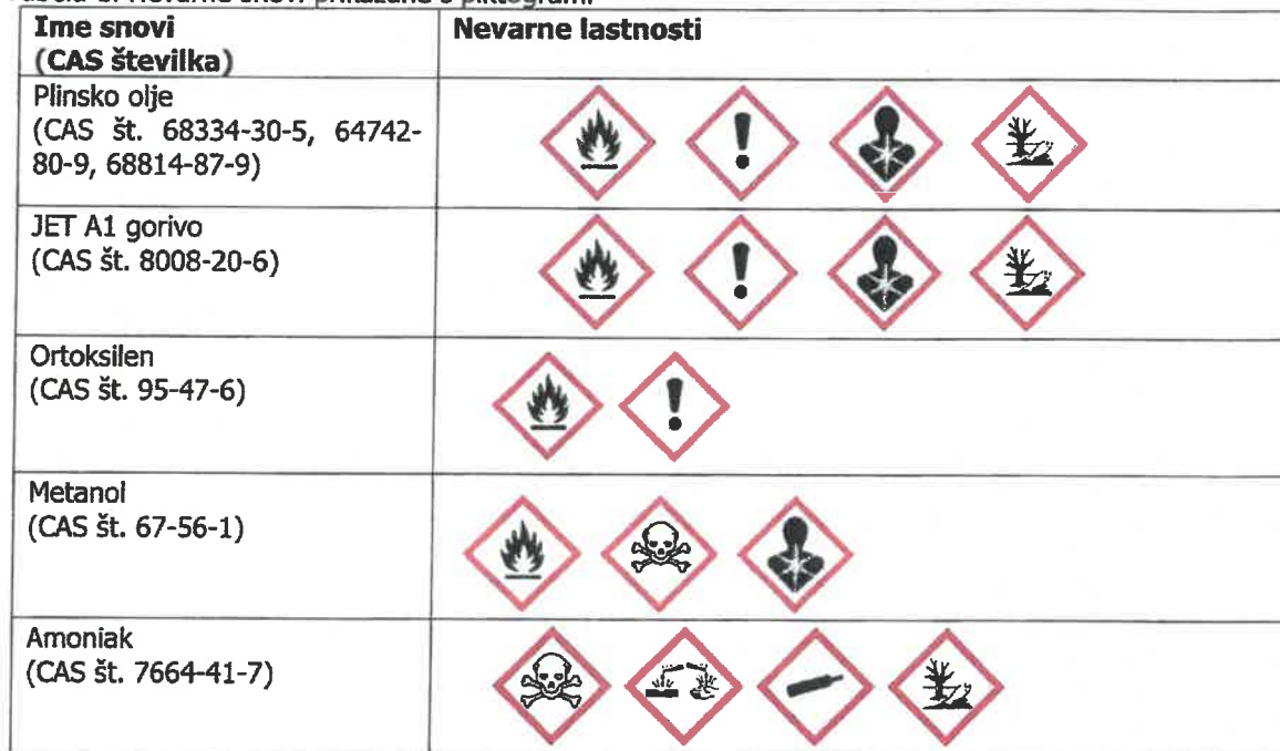
Tabela 1. Nevarne snovi prikazane s piktogrami

V obratu se stalno ali občasno nahajajo večje količine nevarnih snovi kot so: plinsko olje, JET A-1 (gorivo za reaktivne motorje), ortoksilen, metanol in amonijak. Nevarne snovi s piktogramskim prikazom so predstavljene v Tabeli 1.